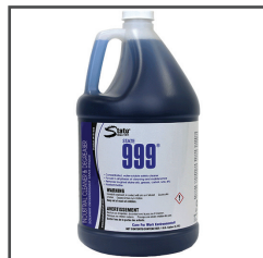
State 999® Dégraissant