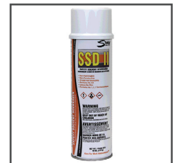
SSD® II Dégraissant tout usage