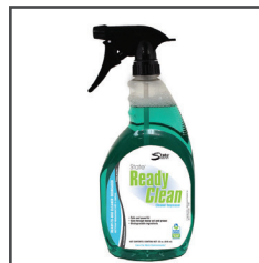
Ready Clean MC Nettoyant dégraissant