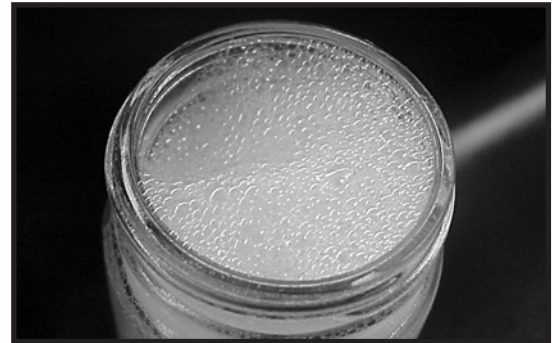
Excellente action moussante