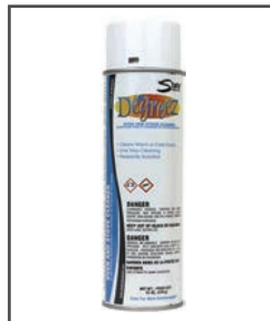
De-Greaz MC Nettoyant pour four et cuisinière