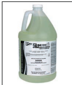
F-362 MC No Rinse Nettoyant et assainisseur sans rinçage