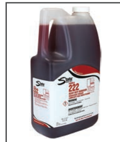
F-222 MC Dégraissant puissant