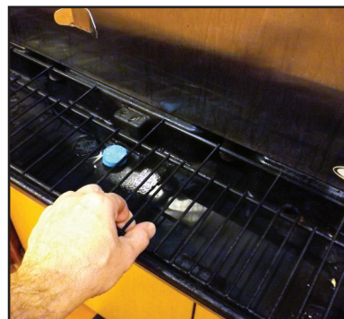
Replacer le dessus du plateau. Et c'est parti!