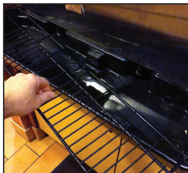
Retirer le dessus du plateau de récupération des liquides