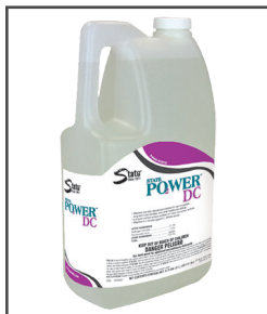
PO 2 WER™ DC Limpiador desinfectante de un solo paso