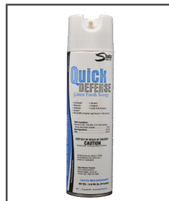
Quick Defense™ Desinfectante listo para usar