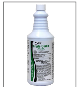
Triple Quick™ Limpiador, desinfectante y desodorizante sin mezcla